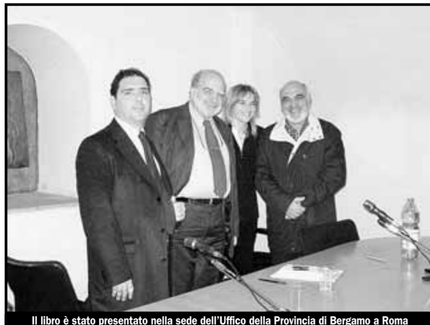
Il libro è stato presentato nella sede dell'Ufficio della Provincia di Bergamo a Roma

«Noi associamo all'Africa i poveri ma non è solo così. In Africa ci sono i poveri, e sono tanti, ma l'Africa non è povera. Se ci rassegniamo, il continente non ce la farà. In una realtà ricca i poveri esistono perché la politica è incapace, non risponde alle esigenze della gente. La povertà in Africa è un dato politico più che economico e questo significa che la nostra responsabilità aumenta perché la politica è frutto della responsabilità degli uomini».